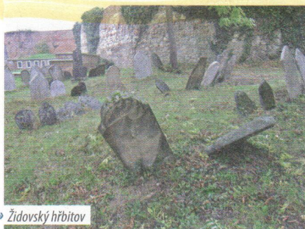
» Židovský hřbitov