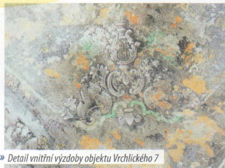
» Detail vnitřní výzdoby objektu Vrchlického 7

Tak jako v minulých letech byly i v letošním roce zastupitelstvem města poskytnuty dotace na obnovu kulturních památek z dotačního programu Podpora rozvoje v oblasti památkové péče, ve kterém byla pro letošní rok alokována částka 500 tis. korun.